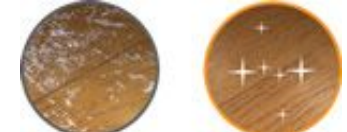
before ⇒ after

各種接着剤、糊残りなどを除去します。環境に配慮した成分を使用。ソールも綺麗に剥がせます。