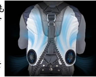
「ターボ」から「弱」まで選べる風量 4モード

雅ヘッド2」もラインナップ。試着品をご用意できなかったのは残念ですが、その機能は折り紙付き。頭部・首元の両方向へ大風量を送り込む大型ファンと、それでいて邪魔にならない薄型設計。嬉しい仕様になっております。他にも「風雅パッド」や「風雅ボディ2」などいろいろなアイテムを揃えておりますので、これらを駆使して暑い夏と闘いましょう。