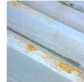
このようなサビに！